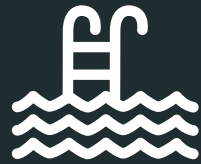
Piscine chauffée Heated swimming pool