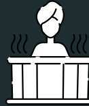
Espace bien-être Wellness area